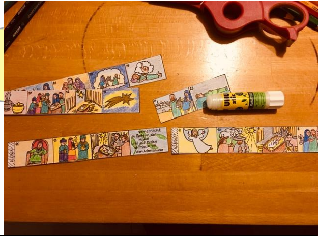
2. Schneide die Bilderstreifen aus und klebe sie zu einer langen Bilderkette der Reihe zusammen.