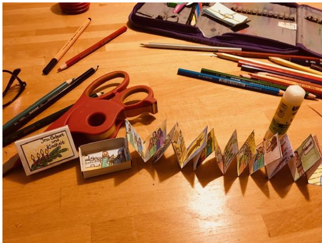
3. Falte den Bilderstreifen zieharmonikaförmig zusammen. Klebe das Bild 24 auf den Boden der Streichholzschachtel. Lege die gefaltete Bilderreihe so hinein, dass das Bild 1 oben aufliegt.