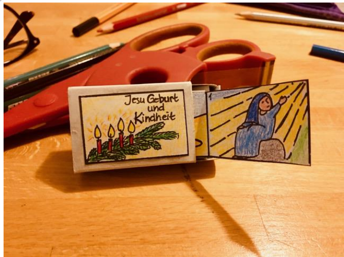
4. Klebe die beiden unnummerierten Bilder an die Vorder- und Rückseite deiner Streichholzschachtel. Schon kannst du jeden Tag im Dezember ein Bildchen aus der Streichholzschachtel ziehen. 😊 Schöööööön!